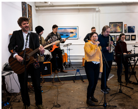
Riffclub på Galleri 70

projekt kan gå till. Kulturhusets vision har alltid varit att stärka deltagarna att själva kunna komma med idéer och initiativ och i förlängningen bli stärkta nog att stå på egna ben. Eftersom Riffclub är självgående är detta en del av kulturhusets verksamhet som kommer finnas kvar i verksamheten så länge deltagarna själva vill och vi ser att det finns en utveckling.