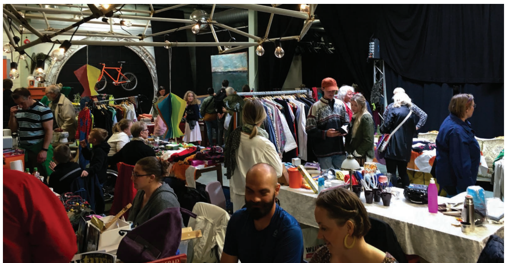
Loppis Dramalogens Kulturhus

Inkludering och integration ligger oss varmt om hjärtat. En av våra deltagare kommer från Afghanistan och har haft en svår tid innan det permanenta uppehållstillståndet kom. Hans pappa avled hastigt och oron är alltid stor för situationen i hemlandet. Han har funnit sig till rätta på både Dramalogen och Kulturhuset, fått nya vänner och mod att söka en konsthantverksskola i Leksand där han blev antagen och började i augusti. Många av deltagarna umgås utanför aktiviteterna och har för första gången på länge skaffat sig ett socialt liv.