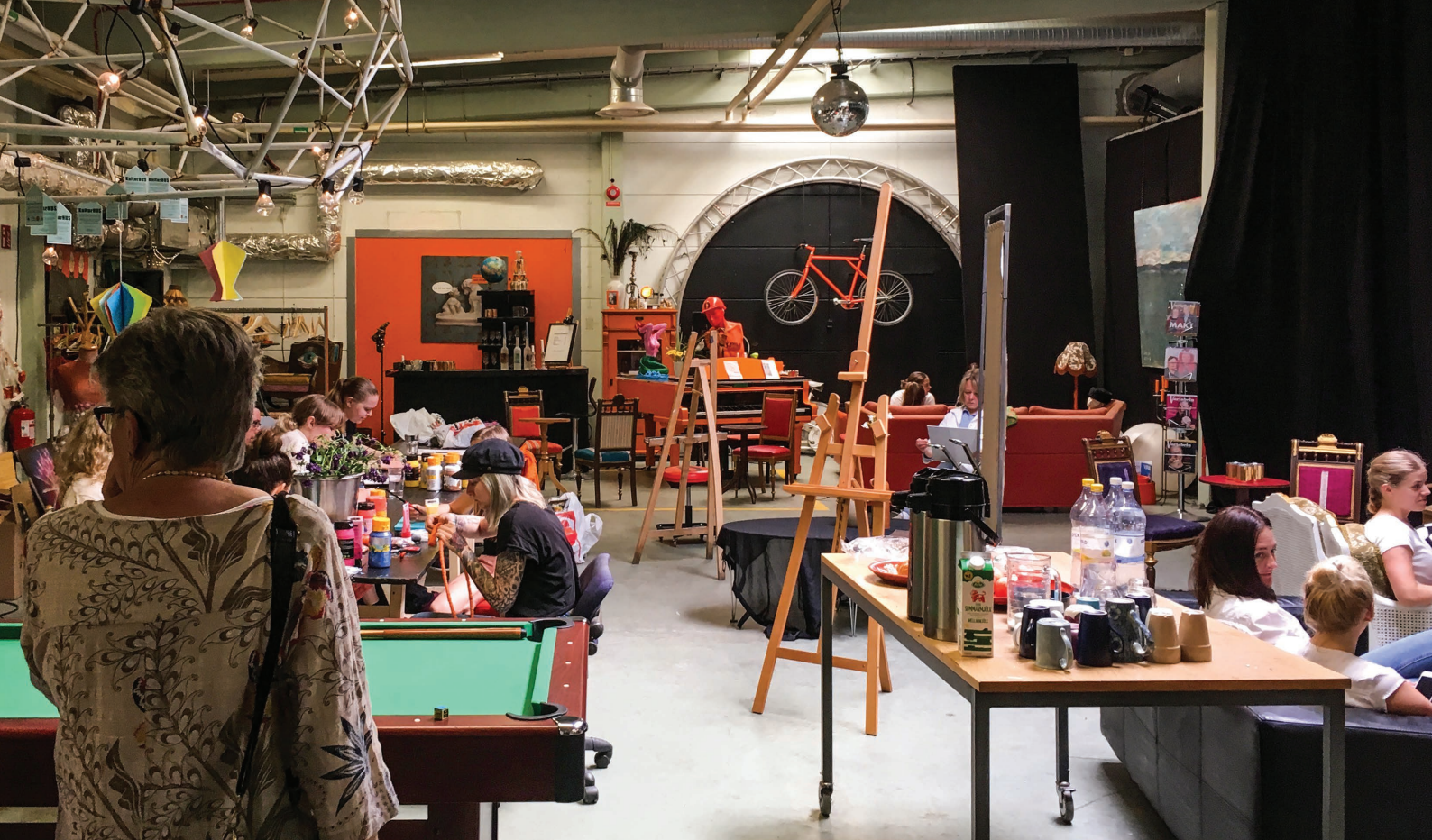
En vanlig dag på Dramalogen

En annan av våra deltagare, som ägnat sig åt måleri och konsthantverk hos oss, har fått hjälp med motivation, ansökningshandlingar och arbetsprover och började nu i höst på konstskola på Öland.