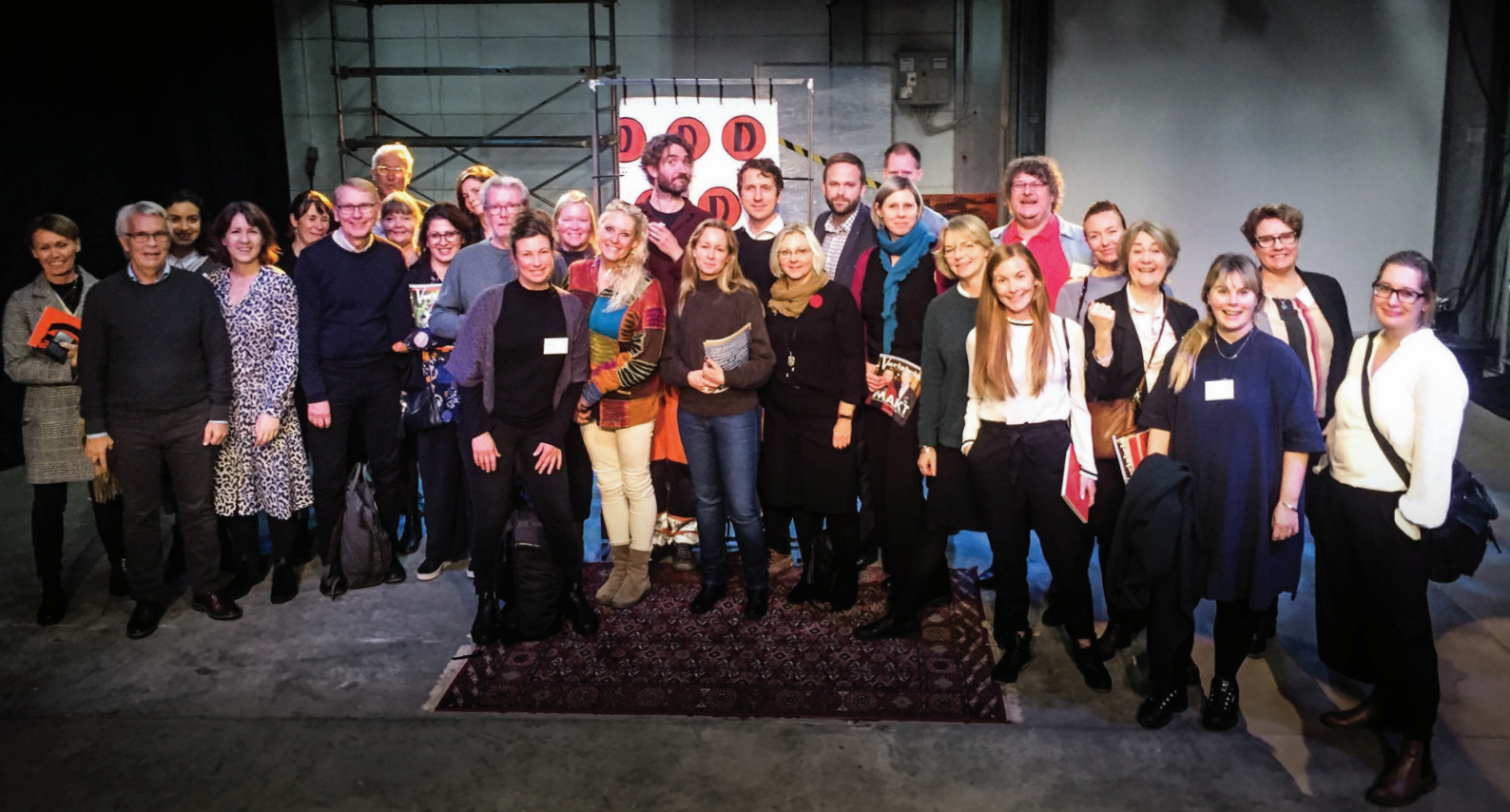
Besök av delegater från SKLs konferens