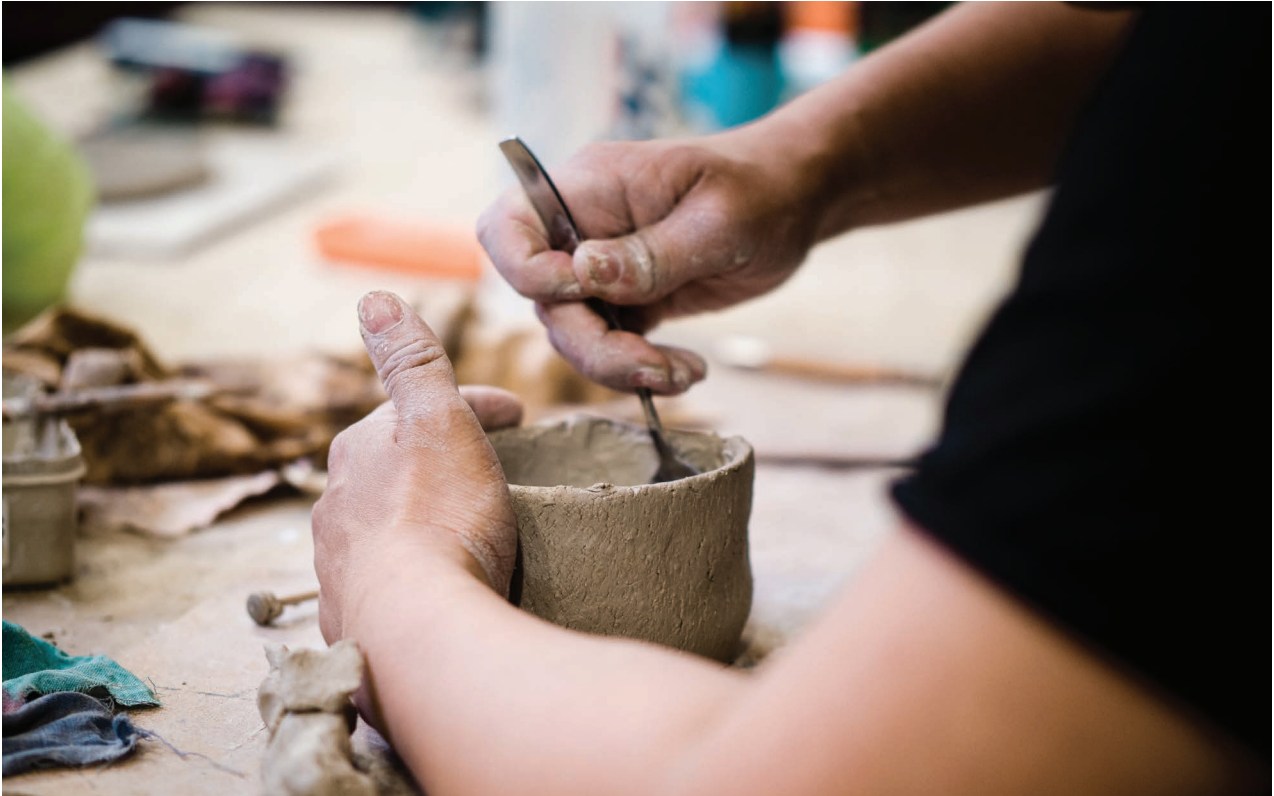
Keramik Dramalogens Kulturhus