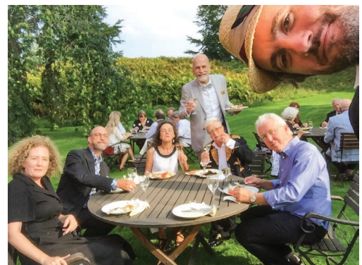
Dramalogen på slottet