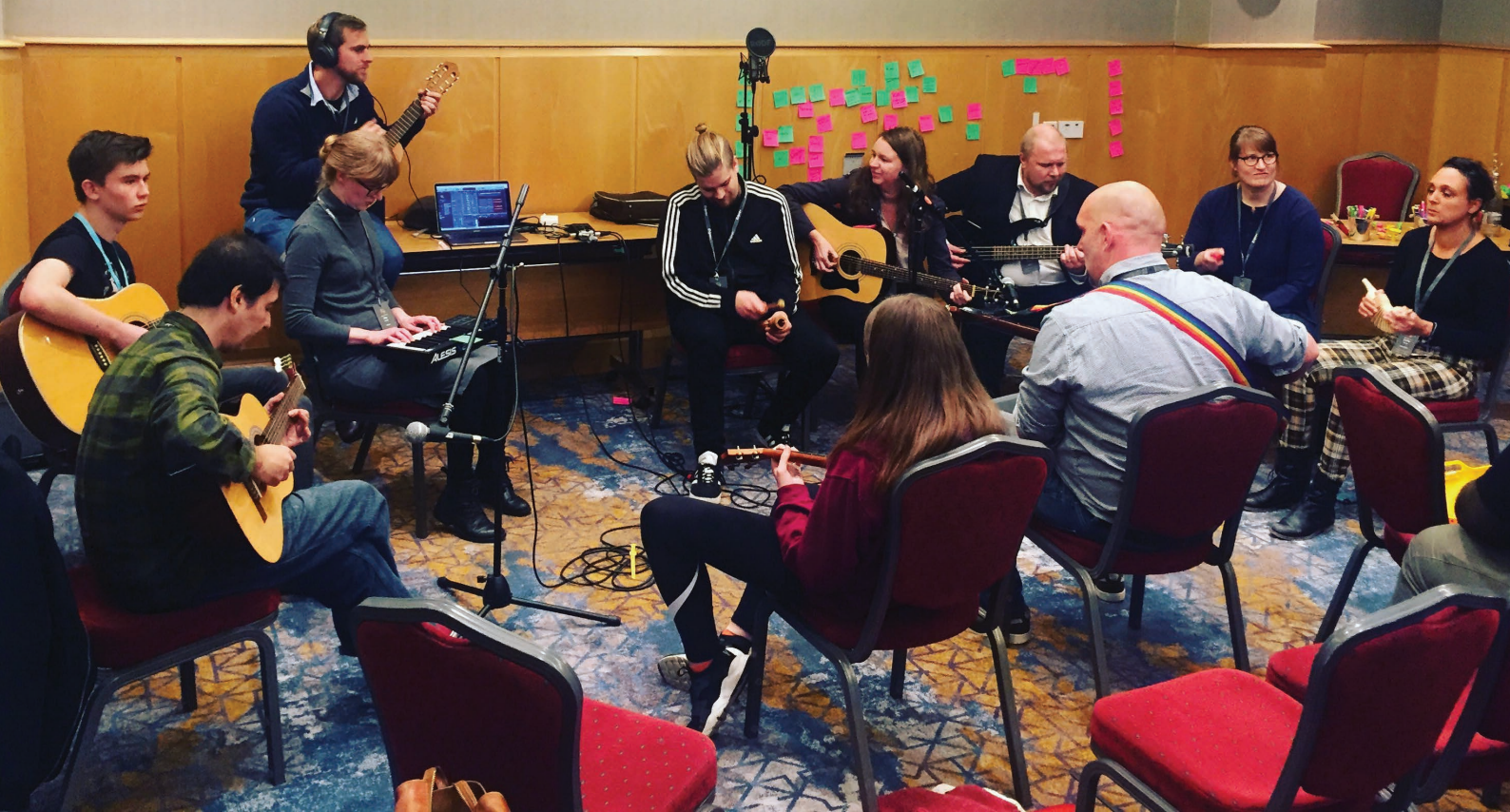
European conference on mental health

Konferensen varade i tre dagar och under torsdagen höll vi tre olika musikworkshops tillsammans med Kukunori, Finland, Scottish recovery network och Musical intervention, New York.