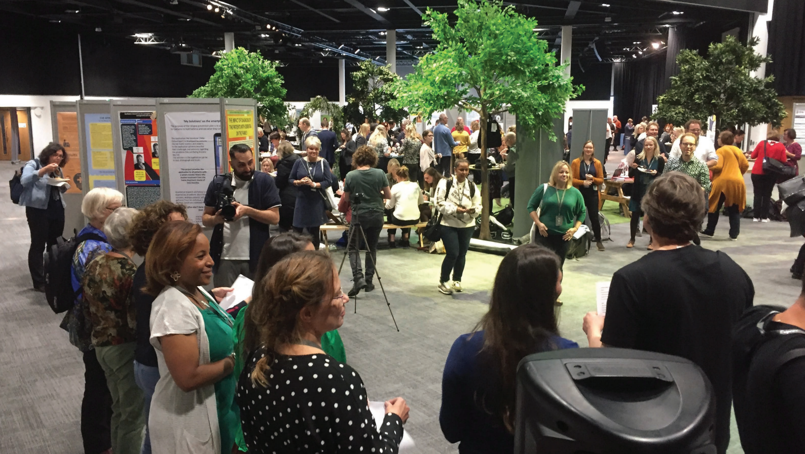
European conference on mental health