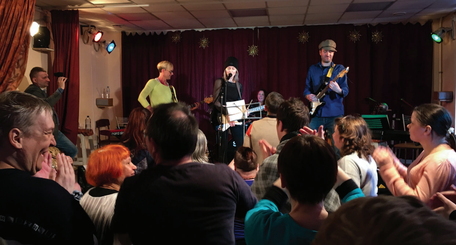
Riffclub i St Petersburg

Dramalogen har sedan lång tid tillbaka samarbete med Finland, Sosped och Kukunori kring Kulturhusidén. Detta har bl.a. resulterat i ett projekt finansierat av Nordiska Ministerrådet där Dramalogen från Sverige, Kukunori och Kaxby från Finland och Mentalsjukhus nr 5 i St Petersburg Ryssland utgjort ett treländerssamarbete.