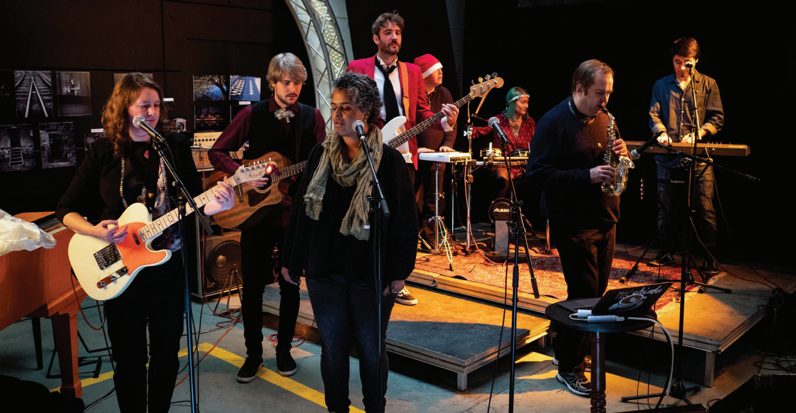
Riff Club Dramalogens Kulturhus