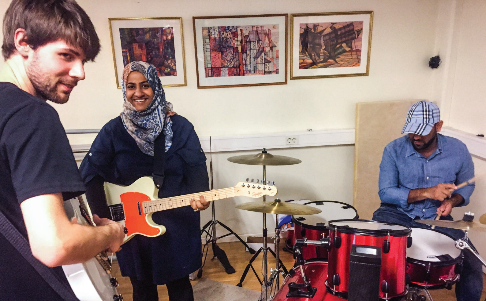
Riff Clubb Dramalogens Kulturhus